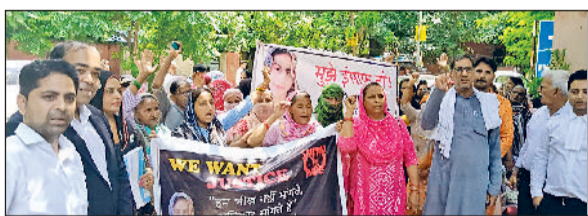
सोनीपत। लघु सचिवालय के बाहर विरोध प्रदर्शन करते हुए।