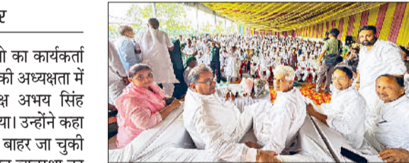
गन्नौर। कार्यक्रमता सम्मेलन के दौरान मंच पर उपस्थित इनलेको राष्ट्रीय अध्यक्ष अभय सिंह चौटाला व पार्टी के नेता।

राजपुर गांव के शिव गंगा गार्डन में इनलेको का कार्यक्रम सम्मेलन हलका अध्यक्ष बिजेंद्र रापरिया की अध्यक्षता में आयोजित हुआ, जिसमें राष्ट्रीय अध्यक्ष अभय सिंह चौटाला ने कार्यक्रमताओं को संबोधित किया। उन्होंने कहा कि भाजपा तो बीते चुनाव में ही सत्ता से बाहर जा चुकी थी। लोग क्यों भ्रष्टाचार, महंगाई, कानून व्यवस्था का दिवाला निकल जाने से इस सरकार को बदलना चाहते थे, लेकिन पूर्व मुख्यमंत्री भूपेंद्र सिंह हुड्डा ने ईडी के दबाव में भाजपा के सामने सरेंडर किया। उन्होंने जानबूझ कर हारने वाले विधायकों को टिकट दिलाए। चौटाला ने कहा कि प्रदेश में अनियंत्रित कानून-व्यवस्था की वजह से लोग असुरक्षित महसूस कर रहे हैं। अब हर घर के बाहर सीसीटीवी लग रहे हैं। जनता अब भाजपा सरकार से त्रस्त है और बदलाव चाहती है। उन्होंने कार्यक्रमताओं से आह्वान किया कि 25 सितंबर को रोहताक में चौ. देवीलाल के जन्मदिवस पर होने वाले सम्मान दिवस कार्यक्रम में भारी