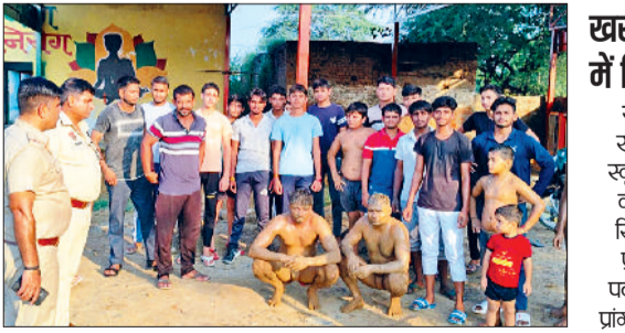
गोहाणा। युवाओं को नशे के प्रति जागरूक करते पुलिस अधिकारी।

मोबाइल फोन से ज्यादा नजदीकी बनाए रखने पर स्वास्थ्य पर बुरा असर होता है और इसके अत्यधिक प्रयोग करने से आंखों पर दुष्प्रभाव, तनाव, अनिद्रा और अन्य स्वास्थ्य समस्याएं हो सकती हैं। मोबाइल फोन की अत्यधिक प्रयोग से बच्चों में सामाजिक कौशल और लोगों से मिलने-जुलने की क्षमता कम हो जाती है। इसके अधिक उपयोग से उनकी शैक्षणिक प्रतिभा पर भी प्रभाव पड़ता है। इसीलिए हमें मोबाइल फोन का उपयोग सीमित समय के लिए ही करना चाहिए।