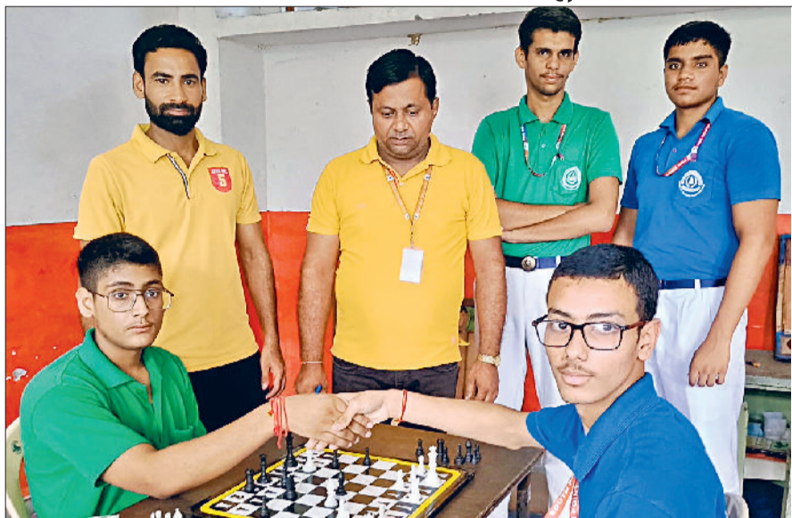
सोनीपत। साउथ पॉइंट में आयोजित प्रतियोगिता में हिस्सा लेते प्रतिभागी।

क्षेत्र के राजकीय एवं गैर राजकीय स्कूल के अंडर-14-17 और 19 आयु वर्ग के खिलाड़ियों ने प्रतिभागिता की