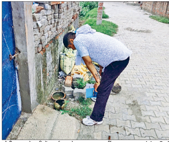
सोनीपत। खड़े पानी में दवाई डालते हुए स्वास्थ्य कर्मी।