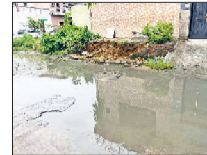
सोनीपत। इंडियन कॉलोनी की गली नंबर 1 में सीवर लीकेज की वजह से इकट्ठा हुआ गंदा पानी।

इंडियन कॉलोनी की गली नंबर 1 में सीवर लीकेज की समस्या ने लोगों का जीना दूभर कर दिया है। लंबे समय से सीवर लाइन से गंदा पानी सड़कों पर बह रहा है, जिसके कारण पूरे क्षेत्र में बदबू और गंदगी फैली हुई है। लोगों का कहना है कि नगर निगम में बार-बार शिकायत करने के बावजूद समस्या का स्थायी समाधान नहीं हो पाया है। तंग आए लोगों ने सीएम विंडो पर शिकायत दी है। शिकायत पर स्थानीय निवासियों ने बताया कि सीवर का गंदा पानी न केवल राहगीरों के लिए परेशानी का कारण है, बल्कि इसने गंभीर स्वास्थ्य संकट भी खड़ा