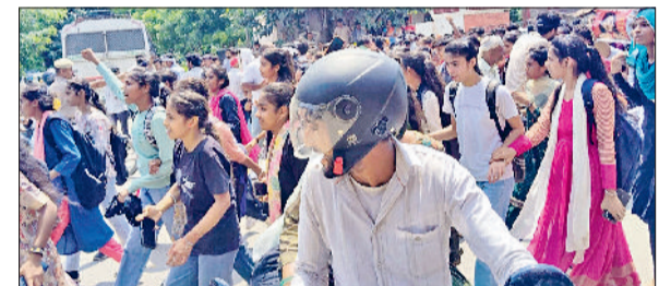
गोहाना। सड़क पर उतरकर प्रदर्शन करते हुए विद्यार्थी