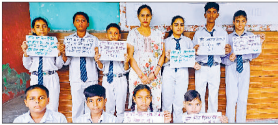
खरखौदा। पोस्टर के माध्यम से अपने संदेश दिखाते विद्यार्थी।