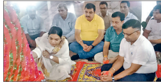
गोहाना। भगवान श्रीकृष्ण की पूजा-अर्चना करते हुए मिल के अधिकारी और कर्मचारी।