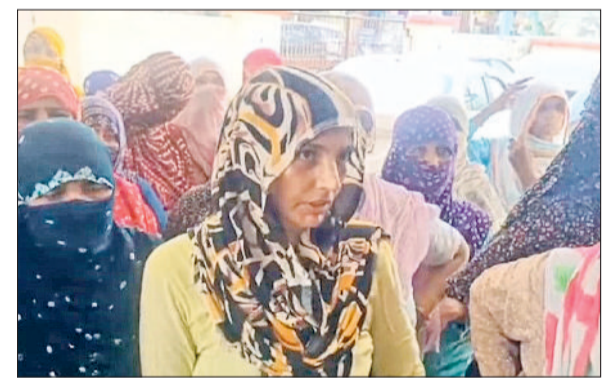
खरखोदा। पुलिस थाना में एकत्रित महिलाएं।

इस मामले में भारी संख्या में महिलाएं और ग्रामीण पुलिस थाने में पहुंचे और न्याय की मांग की। पुलिस ने उन्हें आश्वासन दिया है कि दौषियों के खिलाफ सख्त कार्रवाई की जाएगी। मृतका के परिवार वाले मांग कर रहे हैं कि सभी आरोपियों को तुरंत गिरफ्तार किया जाए। पुलिस