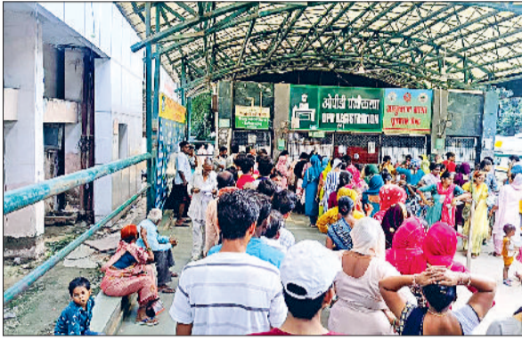
हरिभूमि न्यूज सोनीपत

नागरिक अस्पताल सोनीपत में इन दिनों बुखार और वायरल बुखार के मरीजों की संख्या तेजी से बढ़ रही है। हालात यह हैं कि सुबह से ही रजिस्ट्रेशन काउंटर और ओपीडी के बाहर मरीजों की लंबी-लंबी लाइनें लग रही हैं। अस्पताल स्टाफ के अनुसार पिछले कुछ दिनों में मरीजों की संख्या सामान्य से कहीं अधिक दर्ज की जा रही है। गर्मी और बीच-बीच में हो रही बारिश को इसकी मुख्य वजह बताया जा रहा है। मौसम में बदलाव और मच्छरों के प्रकोप के कारण लोग बड़ी संख्या में बुखार से पीड़ित हो रहे हैं। वहीं जिले में डेंगू के मरीजों की संख्या भी बढ़ चुकी है। विभाग की तरफ से संदिग्ध जगहों पर फॉगिंग के निर्देश दिए जा चुके हैं।